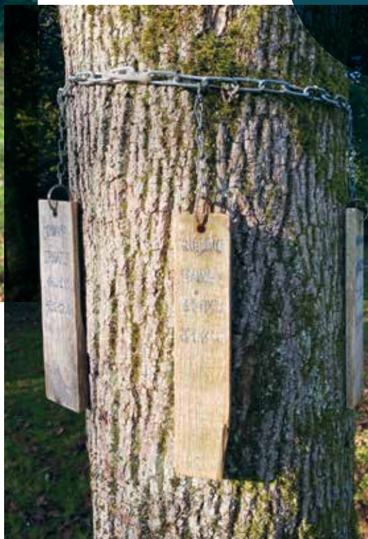
Erinnerung an die Opfer der ersten Deportation am 18. Januar 1940 an den Bäumen beim Mahnmal