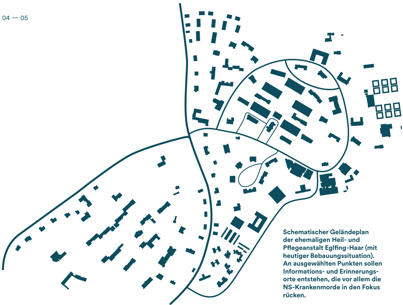
Schematischer Geländeplan der ehemaligen Heil- und Pflegeanstalt Eglfing-Haar (mit heutiger Bebauungssituation). An ausgewählten Punkten sollen Informations- und Erinnerungs-orte entstehen, die vor allem die NS-Krankenmorde in den Fokus rücken.

In Zeiten, in denen es wieder politisch legitim erscheinen mag, Minderheiten auszugrenzen, dem Eigeninteresse das Wort zu reden und die Solidarität gering zu halten, wird das Motto „Der Wert des Lebens“, das sich die Gedenkstätte Hartheim gegeben hat, zum aktuellen Leitspruch. Unsere Einrichtung, das heutige kbo-Isar-Amper-Klinikum, war kontinuierlich Behandlungs-ort für psychisch kranke und behinderte Menschen – in denselben Räumen, in denen die Verbrechen stattgefunden haben. Auch deswegen nehmen wir eine besondere Verantwortung gegenüber den bei uns behandelten Menschen wahr; gegenüber Menschen, die in akuten Krisen sind ebenso wie gegenüber denen, die durch dauerhafte Behinderungen in ihrer Teilhabe am Leben benachteiligt sind.