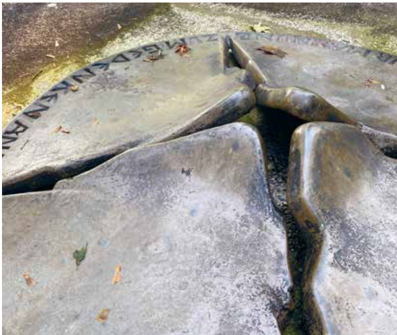
Seit 1990 gibt es in Eglfing-Haar ein Mahnmal für die Opfer der NS-„Euthanasie“.

Am 18. Januar 1940 ging der erste Transport von Patienten der damaligen Heil- und Pflegeanstalt Eglfing-Haar, des heutigen kbo-Isar-Amper-Klinikums, in die Tötungsanstalt Grafeneck. Es war dies die erste Deportation im Rahmen der NS-Krankenmorde im damaligen Deutschen Reich. 25 Menschen haben an diesem Tag ihr Leben verloren. Insgesamt rechnen wir mit etwa 4000 Opfern, die zwischen 1939 und 1945 von Eglfing-Haar aus zur Ermordung deportiert oder hier vor Ort getötet wurden, durch überdosierte Medikamente, Nahrungsentzug oder gezielte Vernachlässigung. Mitarbeiterinnen und Mitarbeiter der Klinik haben selbst zu diesen Verbrechen beigetragen oder sie durch „Wegsehen“ und Unterlassen mit ermöglicht. Es ist uns Verantwortung und Verpflichtung, uns mit dieser Geschichte des Klinikums auseinanderzusetzen.