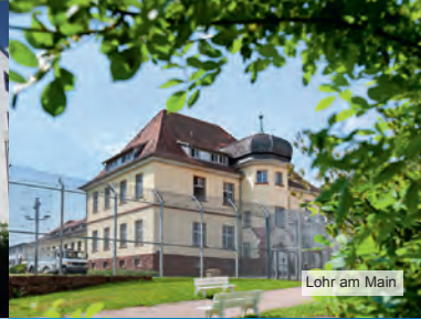
Lohr am Main