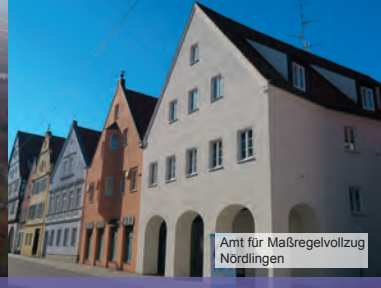
Amt für Maßregelvollzug Nördlingen