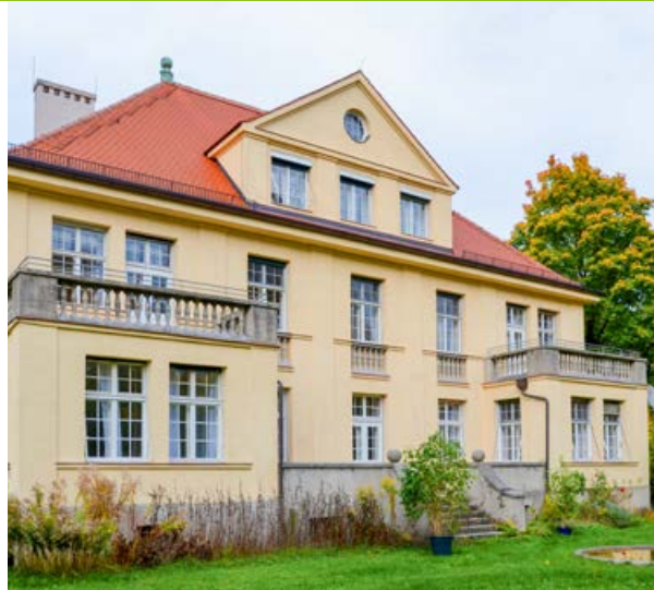
„Villa“ – Haus 18 auf dem Gelände der München Klinik Schwabing

Qualifizierte Entgiftung, suchtspezifische Beratung und Vermittlung in weiterführende Therapien bieten wir auf allen Stationen an.